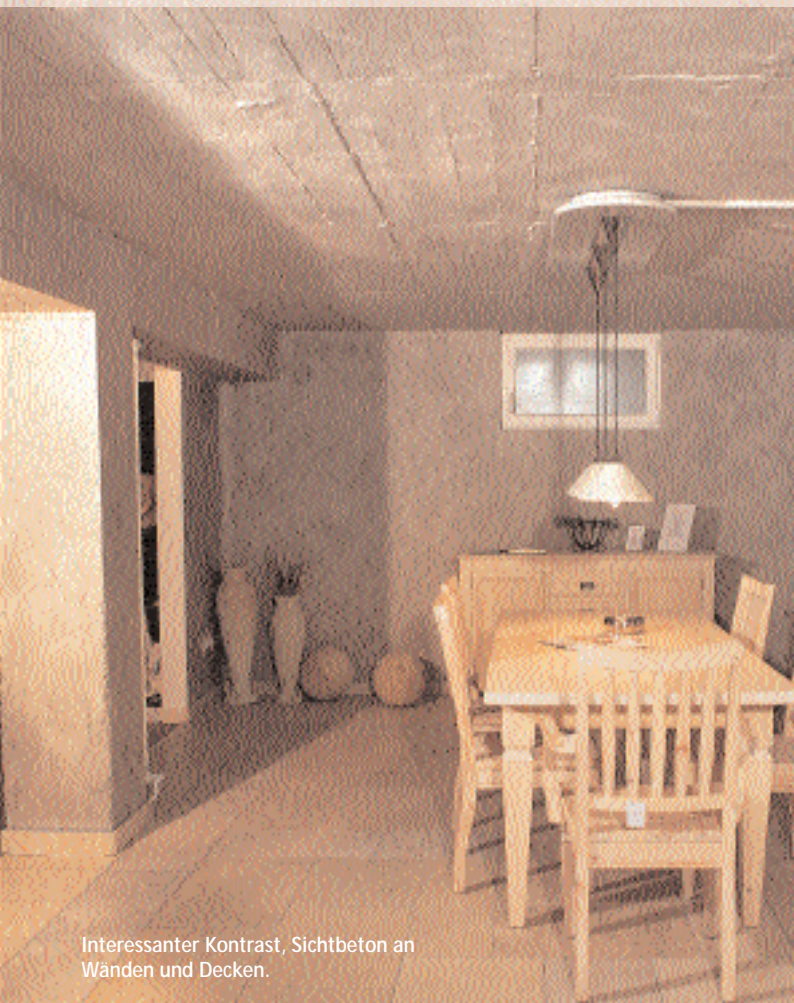
Interessanter Kontrast, Sichtbeton an Wänden und Decken.