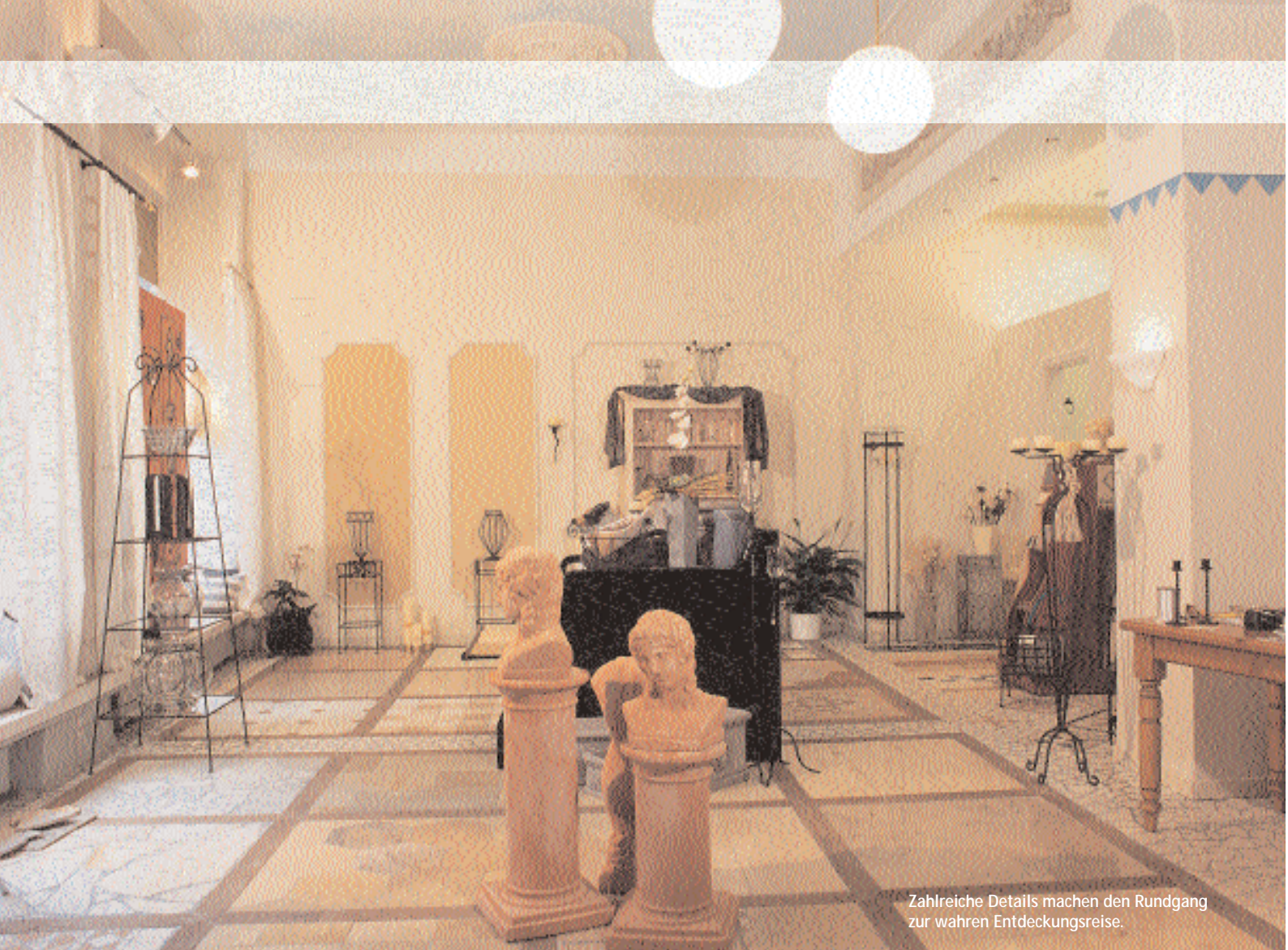
Zahlreiche Details machen den Rundgang zur wahren Entdeckungsreise.