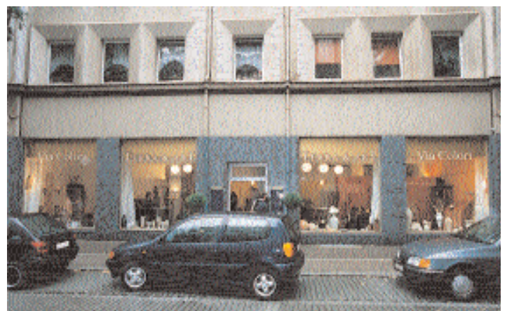
Exklusive Wirkung von außen und anziehende Schaufensterfront.