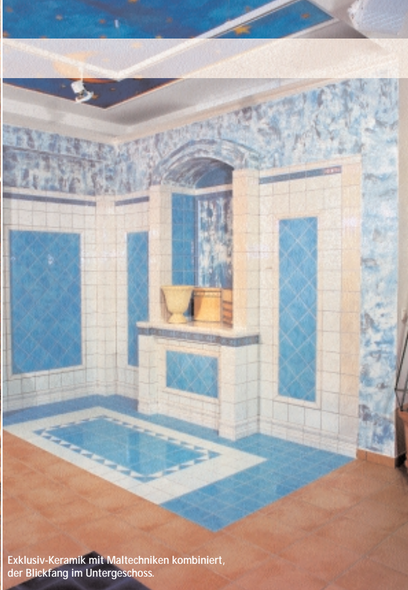
Exklusiv-Keramik mit Maltechniken kombiniert, der Blickfang im Untergeschoss.