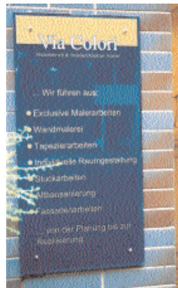
Darstellung der einzelnen Bereiche

Genau dies wollte man mit dem gemeinschaftlichen neuen Studio erreichen. Schon vor der offiziellen Einweihung Anfang September hat man die Bestätigung dafür erhalten.