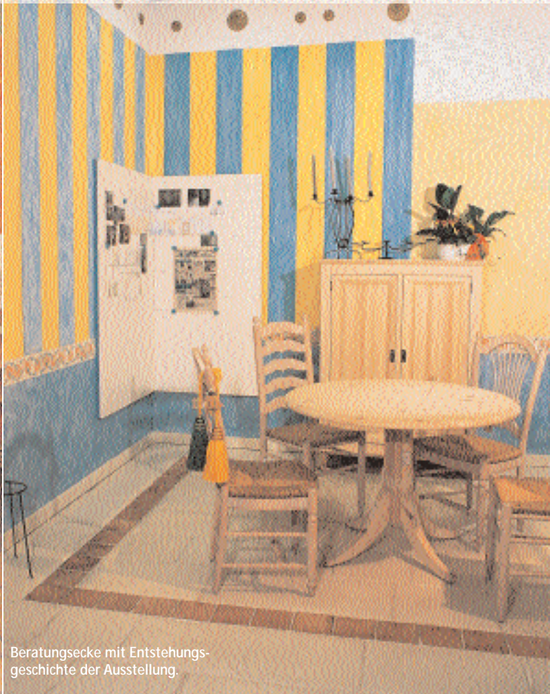
Beratungsecke mit Entstehungsgeschichte der Ausstellung.