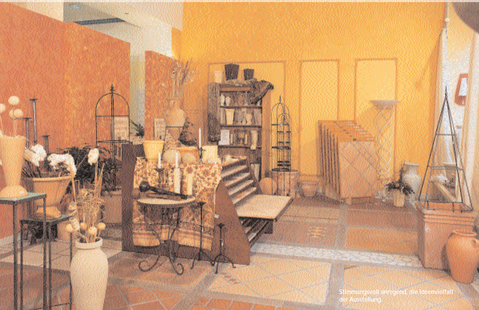
Stimmungsvoll anregend, die Ideenvielfalt der Ausstellung.